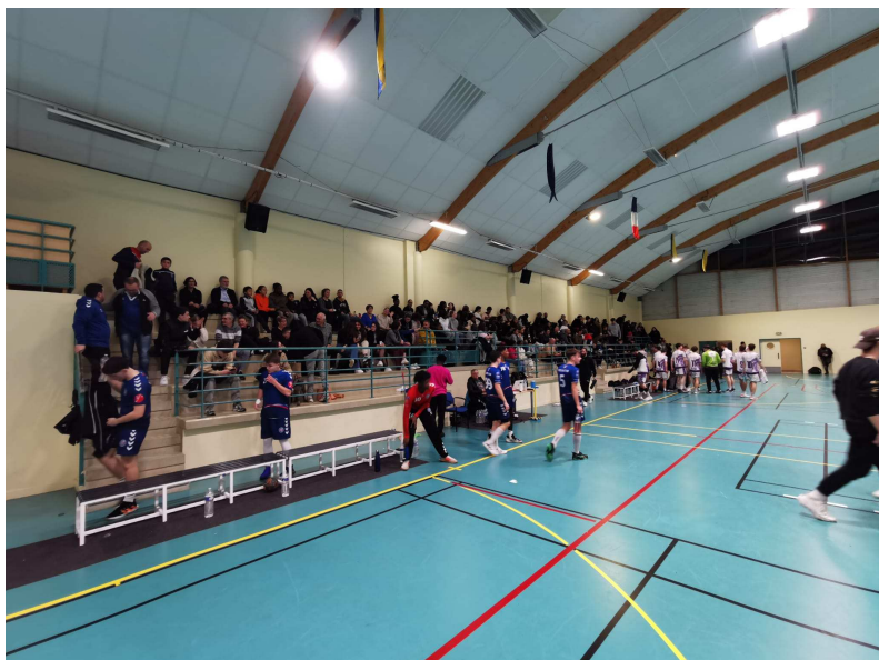
Jour de belle affluence à Dantan pour les U9, U17F et U18M

Un nouveau tournoi était organisé dans notre gymnase en milieu de ce mois. Nos graines de champions avaient l'honneur d'ouvrir une belle journée qui allait se poursuivre avec deux rencontres de championnat de France U17F et U18M. C'était l'occasion pour les plus jeunes de cette catégorie, essentiellement des enfants de 7 ans, de découvrir la compétition et d'affronter Bonnières, Gargenville et Maisons-Laffitte. Ce moment d'apprentissage et de plaisir était apprécié de tous et ne demande qu'à être renouvelé.